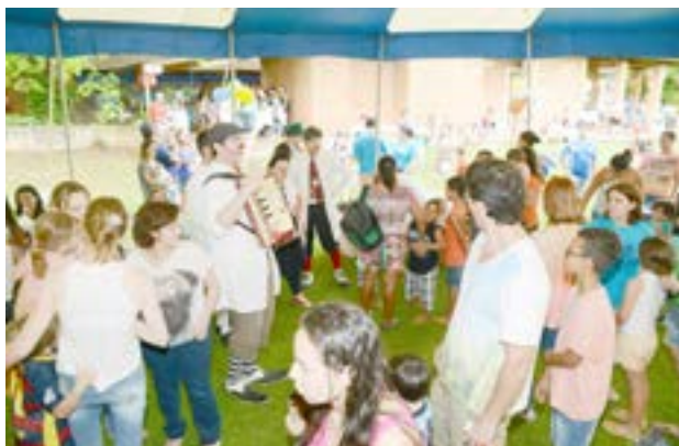
A confraternização ocorreu na área de lazer do Hospital, em meio a muito verde