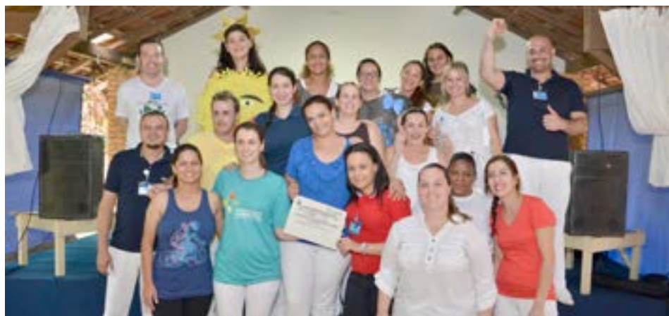
Funcionários participam de Concurso de Paródia, atração da 29ª SIPAT

De 3 a 5 de novembro, a CIPA (Comissão Interna de Prevenção de Acidentes) da Santa Casa de Piracicaba realizou sua 29ª SIPAT (Semana Interna de Prevenção a Acidentes de Trabalho) que, este ano, discutiu o processo de prevenção de acidentes no ambiente hospitalar, empreendedorismo, reciclagem e meio ambiente e, ao final, premiou os vencedores dos concursos de paródia e reciclagem.