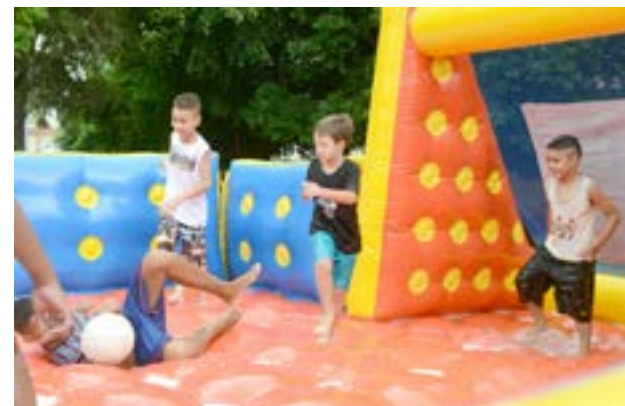
Diversos brinquedos foram instalados especialmente para as crianças

No mês dedicado às crianças, a Santa Casa de Piracicaba preparou um dia especial, repleto de brincadeiras e atividades para os filhos de funcionários da Instituição. Além de reverenciar a data, a ideia foi promover a integração entre a família e o complexo hospitalar durante a confraternização, realizada no último dia 31 de outubro, na área de lazer do Hospital.