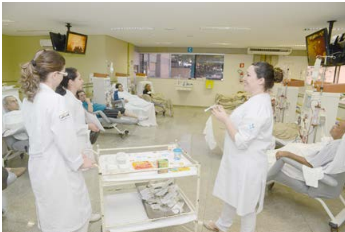
Equipe apresenta alimentos prejudiciais à saúde devido à grande quantidade de sódio e distribuem sachês do sal de ervas

A mistura é simples e acumula os efeitos benéficos das plantas, que podem variar de acordo com a preferência de cada um. A receita básica inclui sal, orégano, alecrim, manjerição e salsinha. O orégano tem alto poder antioxidante e propriedades anti-inflamatórias e antibacterianas. O alecrim tem ação antioxidante e cicatrizante, inibindo o crescimento de bactérias. O manjerição é rico em magnésio, ferro, cálcio e vitamina C. Possui flavonóides que protegem as estruturas celulares, os cromossomos contra a radiação e contra os efeitos dos radicais livres. A salsinha auxilia no tratamento de cálculo renais.