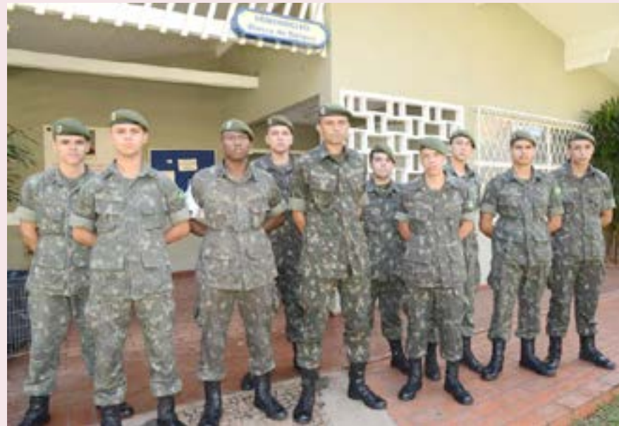
A prática de ações voluntárias, a exemplo da doação de sangue, é uma das lições estimuladas pelo TG junto aos seus atiradores