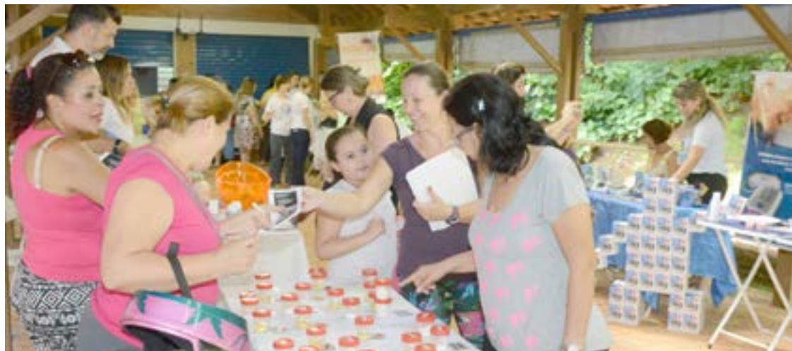
Concurso trouxe novidades no cardápio alimentar de portadores de Diabetes Mellitus

Organizado pelo Centro de Prevenção e Promoção da Saúde do Santa Casa Saúde, o IV Simpósio de Diabetes aconteceu de 9 a 14 de novembro com ações de alerta e combate à doença, palestras, oficinas de culinária saudável e atividades externas no Parque da Rua do Porto.