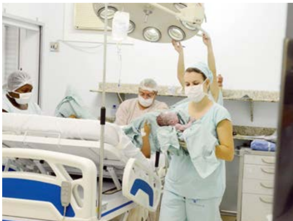
Hospital mantém uma média mensal de 150 partos; pelo menos 9% deles são de alto risco

Segundo ele, a Santa Casa mantém uma média mensal de 150 partos; deste total, pelo menos 9% são de alto risco. "São casos em que a mãe e/ou o feto apresentam chances de adoecer ou ir a óbito devido a síndromes hipertensivas e hemorrágicas, alterações do crescimento fetal e na duração da gravidez,