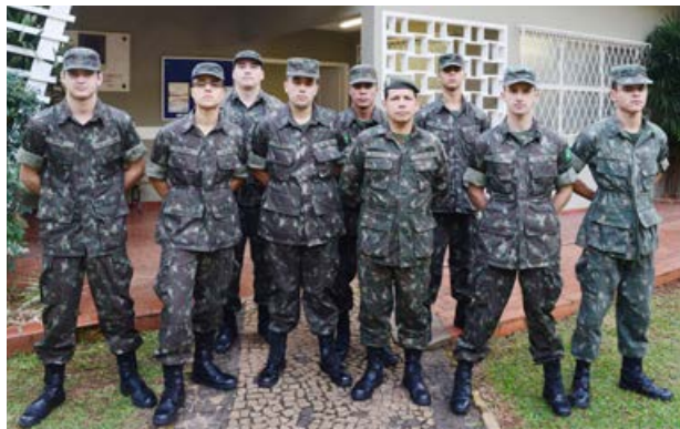
Proposta é que a doação seja frequente entre os atiradores