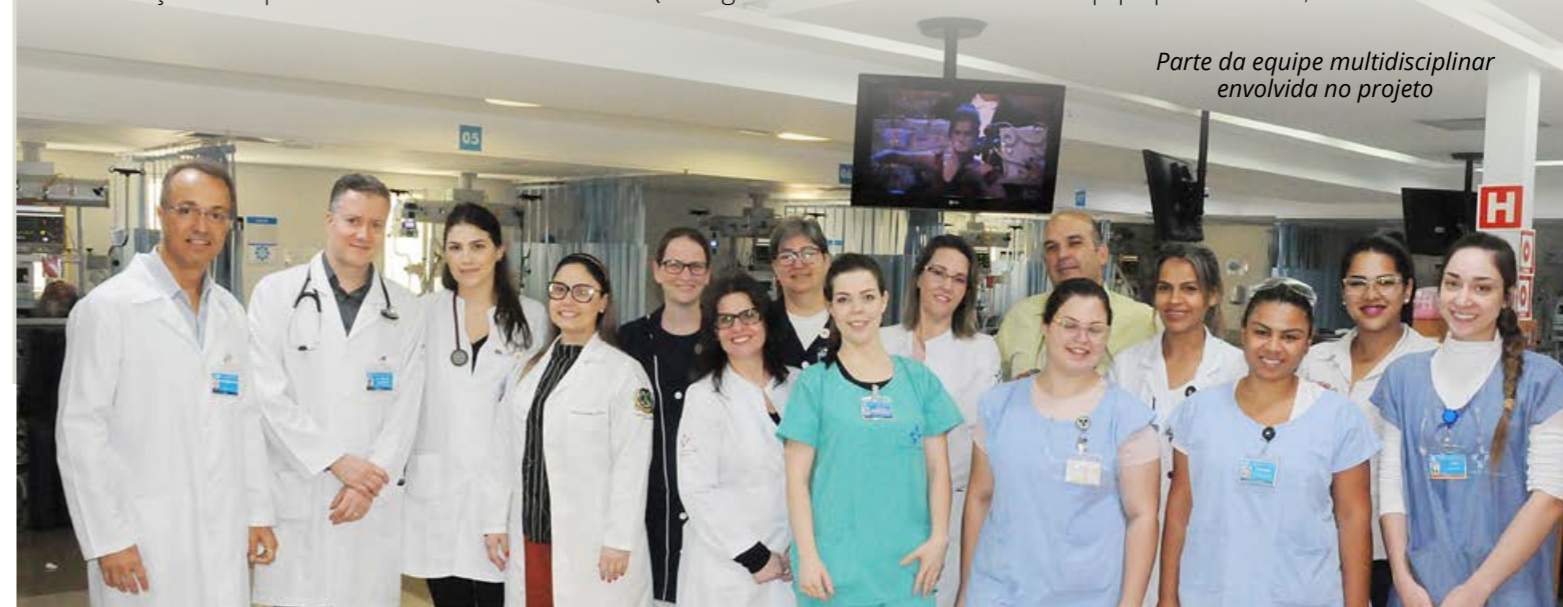
Parte da equipe multidisciplinar envolvida no projeto