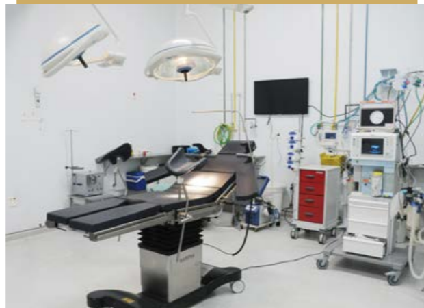
As duas modernas mesas cirúrgicas são utilizadas na realização de cirurgias de média e alta complexidades

VERBA É PROVENIENTE DA PRESTAÇÃO PECUNIÁRIA E REFORÇA O PAPEL SOCIAL DO PODER JUDICIÁRIO