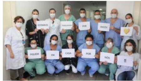
Apelo das equipes multiprofissionais de Enfermagem, Higienização e Nutrição: "Estamos aqui por vocês; fiquem em casa por nós!"

Santa Casa mantém equipes na linha de frente e lança campanha para doações