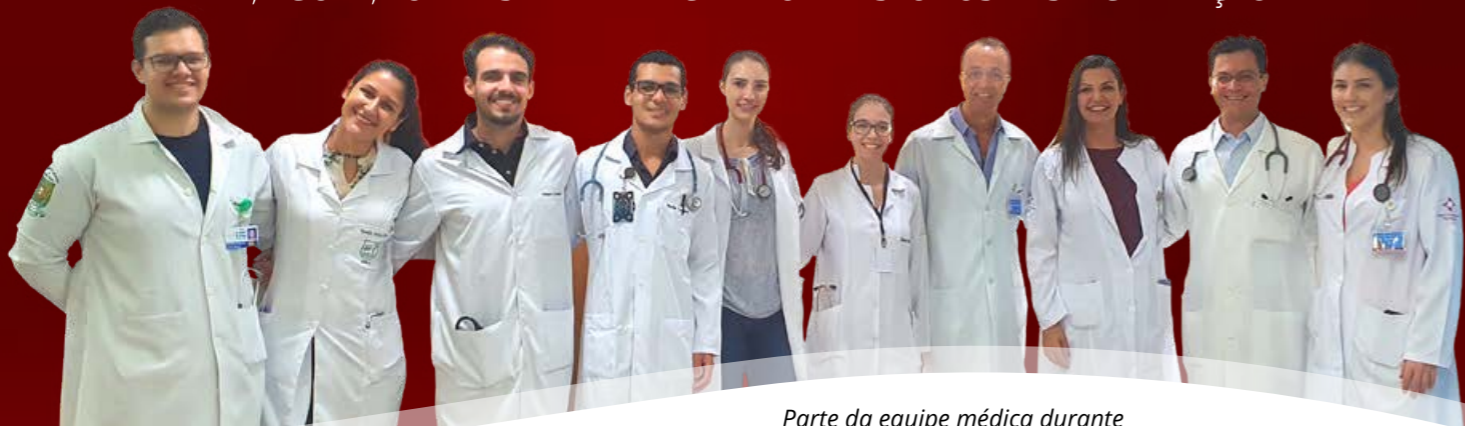
Parte da equipe médica durante discussões diárias de caso

UNIDADE ATUA COMO CENTRO REGIONAL NO ATENDIMENTO DAS EMERGÊNCIAS DO CORAÇÃO E, AGORA, TORNA-SE TAMBÉM CENTRO DE ESTUDOS E ESPECIALIZAÇÃO